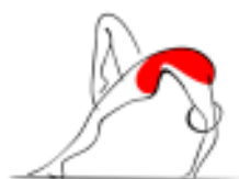
GAF – SAN BENEDETTO

Il Comitato regionale Marche ha ottenuto il riconoscimento di "Campus Scuola Federale" sulla base dei seguenti progetti: