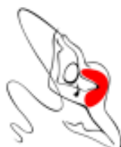
GR – FANO