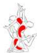
GpT/GAM/GAF/ - FERMO